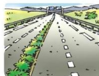
Besoin de se déplacer