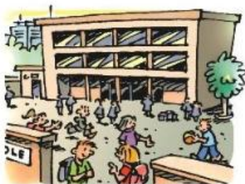
Besoin d'éduquer les enfants