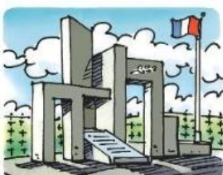
Besoin de se souvenir