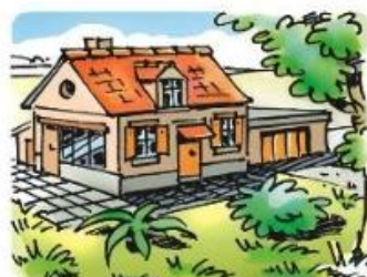
Besoin de se loger