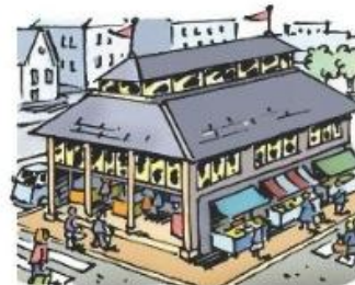
Besoin de faire du commerce